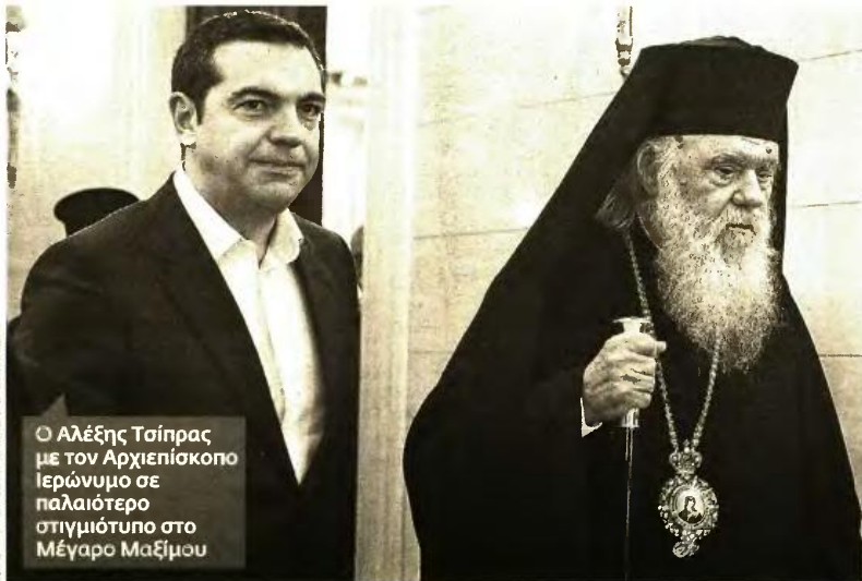
Ο Αλέξης Τσίπρας με τον Αρχιεπίσκοπο Ιερώνυμο σε παλαιότερο στιγμιότυπο στο Μέγαρο Μαξίμου