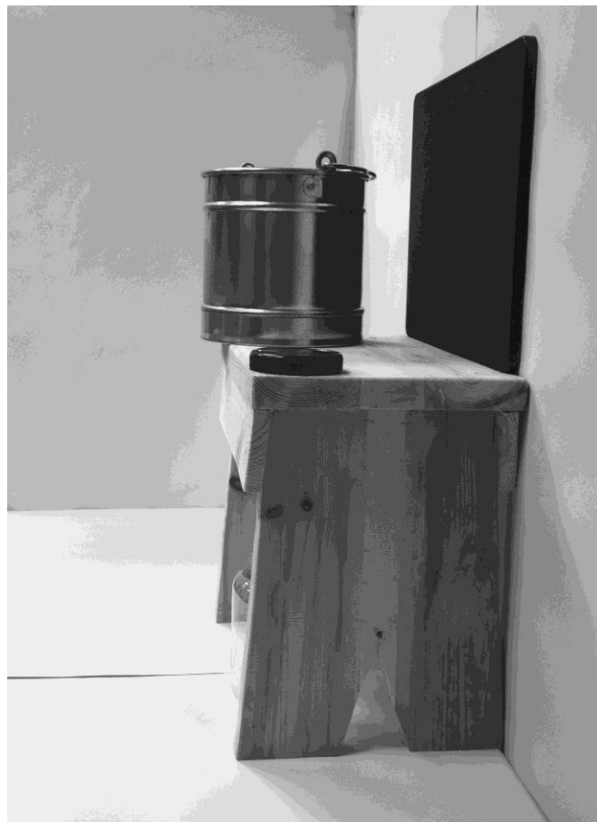
τέταρτη φωτογραφία: πλάγια όψη 2