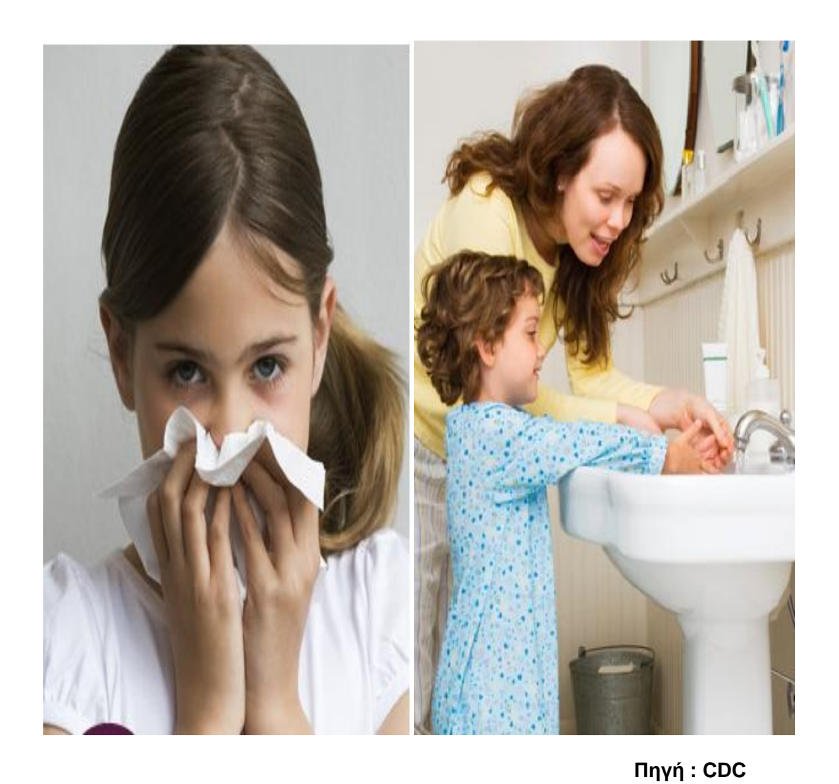
Κάλυψε με χαρτομάντιλο τη μύτη και το στόμα σου, όταν φτερνίζεσαι ή βήχεις.