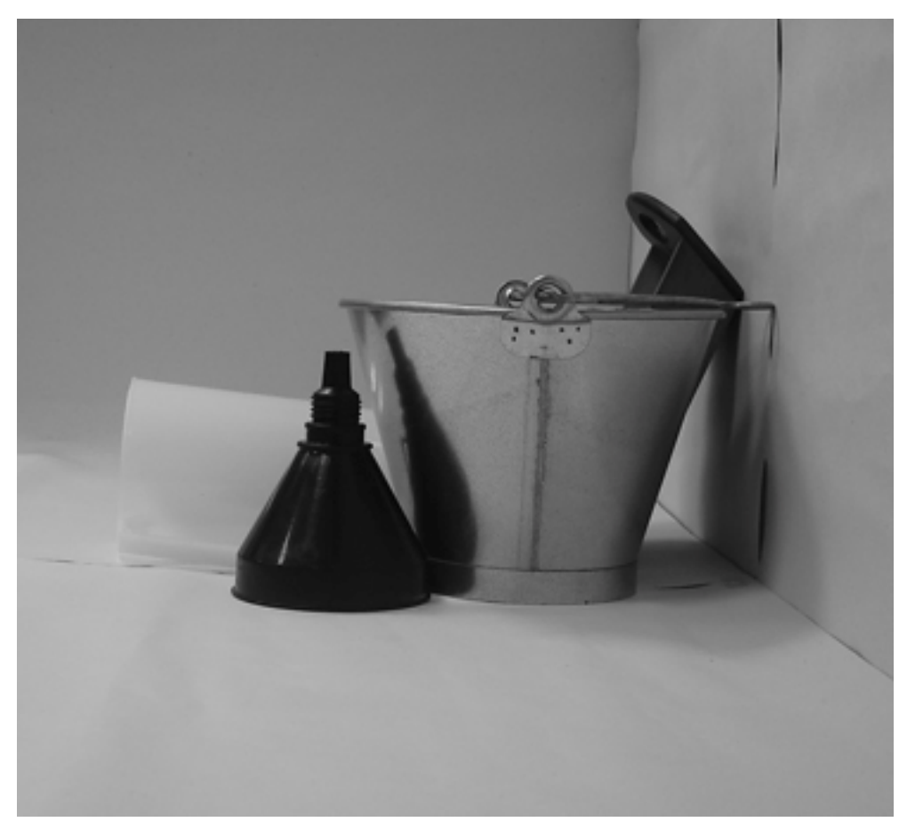
τέταρτη φωτογραφία: πλάγια όψη