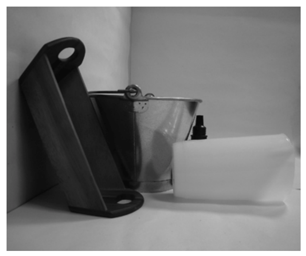
τρίτη φωτογραφία: πλάγια όψη