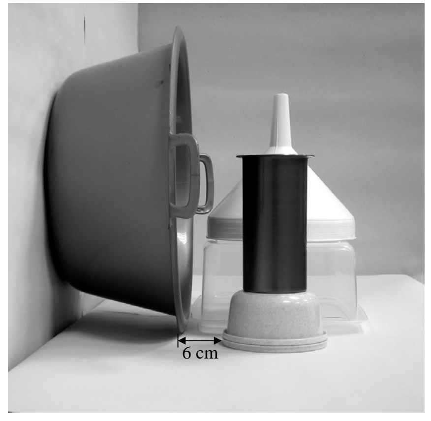
τρίτη φωτογραφία: πλάγια όψη