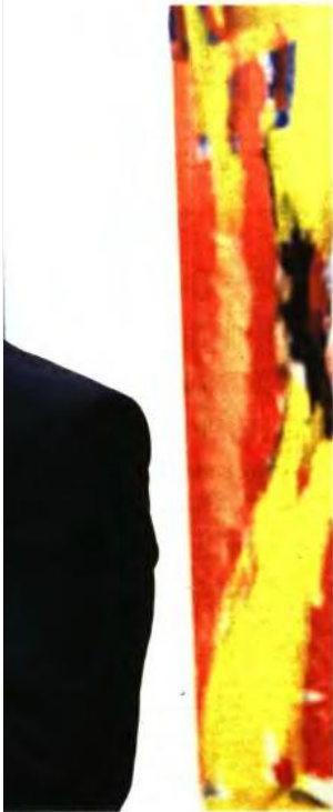
ΕΠΙΧΕΙΡΗΣΗ / ΙΑΝΝΗΣ ΠΑΝΑΓΙΩΤΙΔΗΣ

Η Τουρκία, μέσα στη δίνη των εσωτερικών προβλημάτων της, καταφέρνει με τη στρατηγική της όξυνσης και των απειλών να κάνει την ψυχραιμία της και βεβαίως να απομονώνεται διεθνώς. Η οικονομία της επιδεινώνεται, εκφράσεις και πράξεις διασφάνιας με την κυβέρνηση στα σχολεία και στα πανεπιστήμια ποινικοποιούνται. Τα σύνορα του Αιγαίου είναι αδιαμφισβήτητα και κατοχυρώνονται με βάση διεθνείς συνθήκες. Επίσης, η Ευρωπαϊκή Ένωση έχει πάρει σαφή θέση για όσα συμβαίνουν το τελευταίο διάστημα με τη γείτονα, που θα πρέπει να κάνει κίνηση 180° και να αποκλιμακώσει τις προκλήσεις της. Η Ελλάδα αντιμετωπίζει το θέμα αυτό με απόλυτη ψυχραιμία και με όρους διεθνούς δικαίου και αυτό θα συνεχίσει να κάνει.