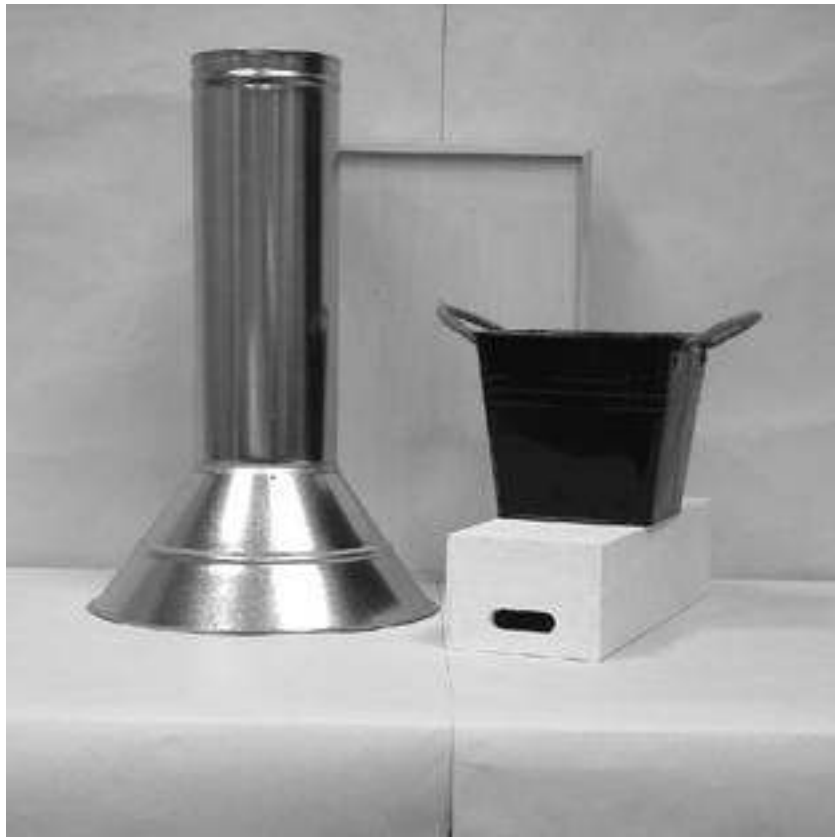
Πρώτη φωτογραφία: Μπροστινή όψη