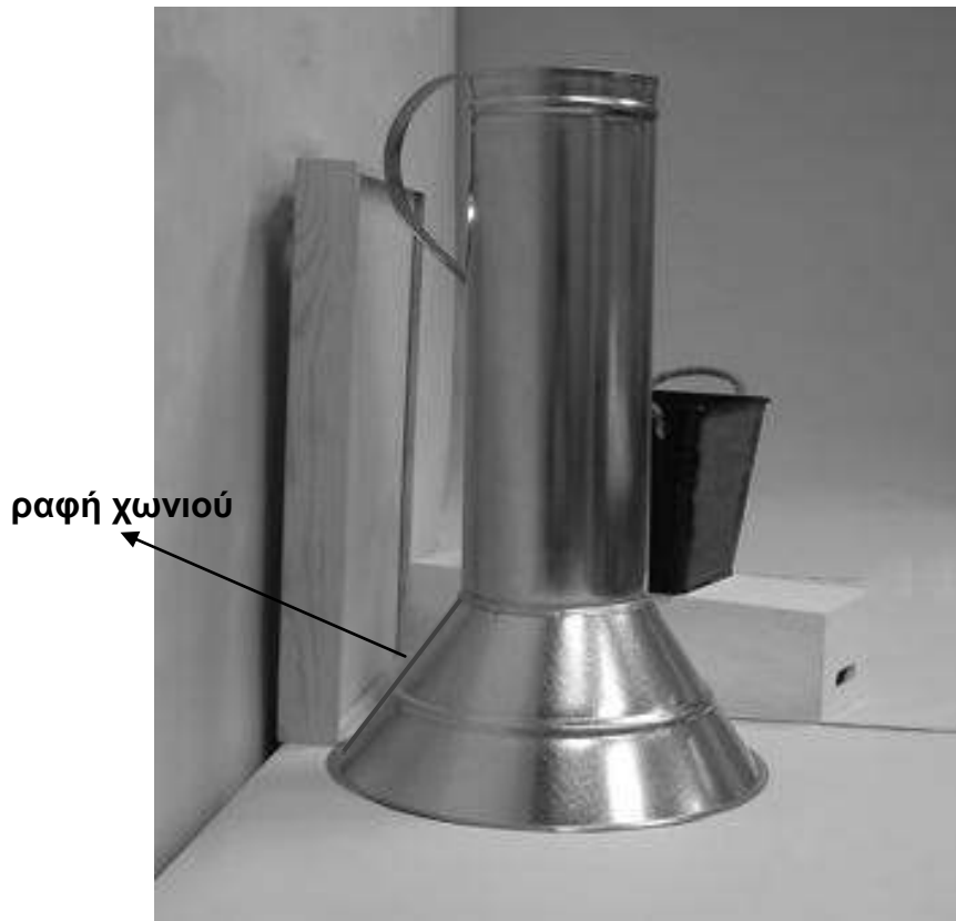
Τρίτη φωτογραφία: Πλάγια όψη