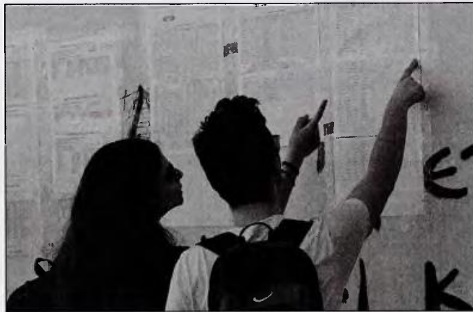
Η πτώση των μορίων στις περιζήτητες σχολές των Πολυτεχνείων αλλά και στα Οικονομικά τμήματα μπορεί να φθάσει και τα 1000 με 1500 μόρια

κοποιήσουν τις επιλογές τους για την τριτοβάθμια εκπαίδευση καθώς παρατείνεται έως και την Τρίτη, 18 Ιουλίου η προθεσμία για την υποβολή των μηχανογραφικών δελτίων των υποψηφίων για την τριτοβάθμια εκπαίδευση. Σύμφωνα με τις τελευταίες εκτιμήσεις αναλυτικά ανά πεδίο εκτιμάται ότι: