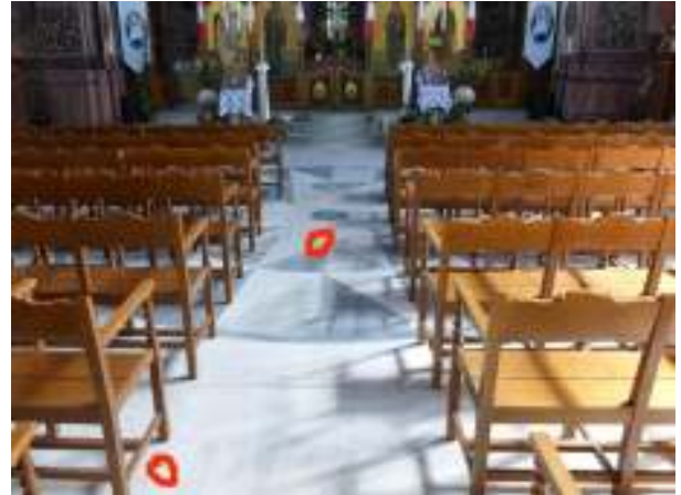
Τα σημεία που βρέθηκαν οι πέτρες.