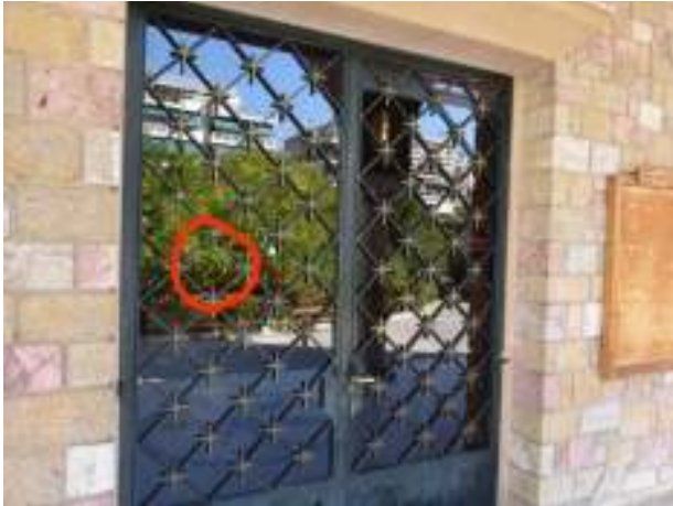
Το σημείο της πόρτας από όπου εισήλθε η πέτρα στο εξωτερικό του ναού.

Ημ/νία συμβάντος: 16/17 Ιουνίου 2015 (βλ. ανωτέρω ενότητα II.B.2)