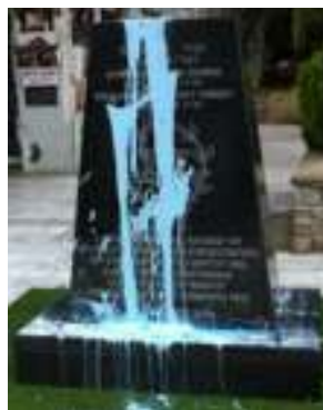
21 Ιουνίου 2015, Μνημείο Ολοκαυτώματος, Καβάλα