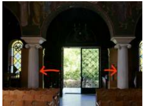
Οι δύο κολόνες που και εκεί έγραψαν παρόμοιες φράσεις.