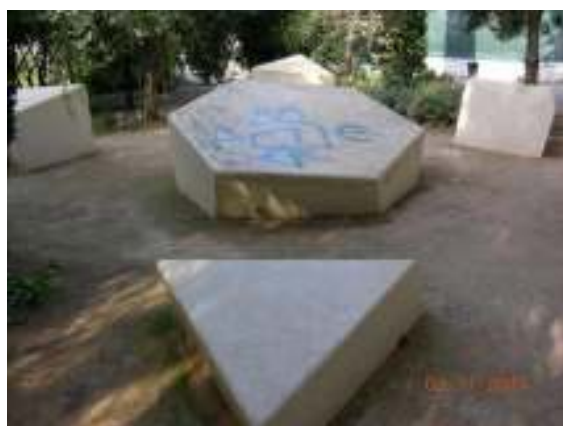
30 Οκτωβρίου 2014, Μνημείο Ολοκαυτώματος, Αθήνα