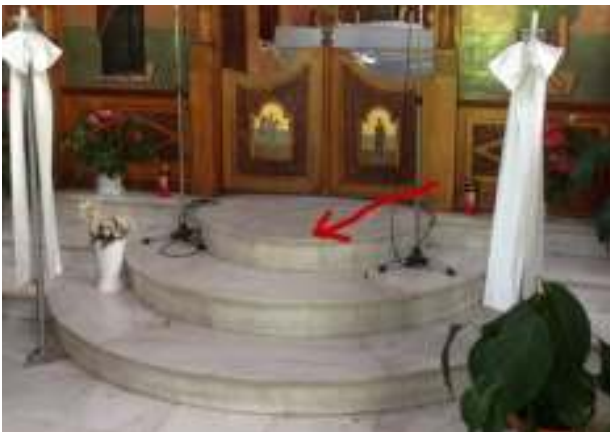
Τα σκαλιά του Ιερού όπου έγραψαν με μαρκαδόρο την φράση «ο Αλλάχ είναι μεγάλος» στην αραβική.