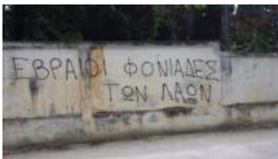
6-7 Ιουνίου 2015, Εβραϊκό Νεκροταφείο, Καβάλα