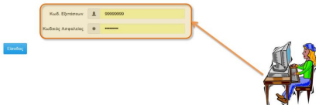
Εικόνα 3: Εισαγωγή Κωδικού Εξετάσεων και Κωδικού Ασφαλείας του επιτυχόντα

Στη οθόνη αυτή ο επιτυχόντας καλείται να εισάγει τον Κωδικό ΕΞΕΤΑΣΕΩΝ και τον Κωδικό ΑΣΦΑΛΕΙΑΣ όπως φαίνεται και στην εικόνα που ακολουθεί.