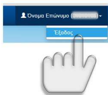
Εικόνα 6: Έξοδος από την εφαρμογή

Σε οποιοδήποτε σημείο της διαδικασίας, ο επιτυχών μπορεί επίσης να εξέλθει της εφαρμογής (για την εισαγωγή του θα πρέπει να επαναλάβει τα βήματα αυθεντικοποίησης που περιγράφουμε στο κεφάλαιο 3.1), με το πάτημα του συνδέσμου Έξοδος , όπως φαίνεται και στην εικόνα που ακολουθεί.