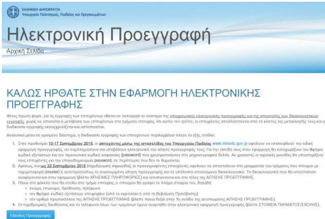
Εικόνα 1: Αρχική Σελίδα Εφαρμογής

Κατά την είσοδο στο ΣΥΣΤΗΜΑ ΗΛΕΚΤΡΟΝΙΚΗΣ ΠΡΟΕΓΓΡΑΦΗΣ ο επιτυχόντας πλοηγείται στην αρχική σελίδα της εφαρμογής όπως φαίνεται στην εικόνα που ακολουθεί.